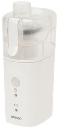
▲ OMRON 雾化器 NE-U200

本产品是一种吸入疗法，将含有干细胞来源外泌体的液体通过雾化器转化为微细气溶胶，通过鼻腔-脑通路送达体内。外泌体可经由鼻腔黏膜吸收，进一步到达中枢神经系统。